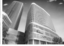
5. Indochina Plaza Hanoi (2012)