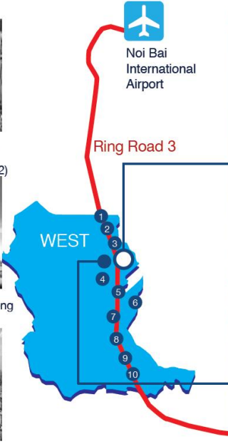
LEADVISORS TOWER (2019)