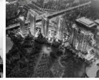
9. D'Capitale (2018)