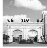
2. Ciputra (2012)