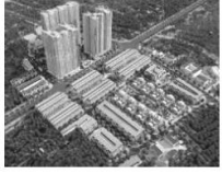
4. Vinhomes Gardenia (2018)