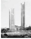
1. Vietin Tower (2018)