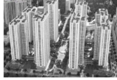
3. An Binh City (2017)