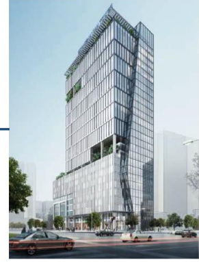
Ministry of Public Security